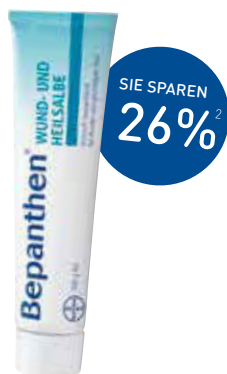
Bepanthen Wund- u. Heilsalbe – 100g