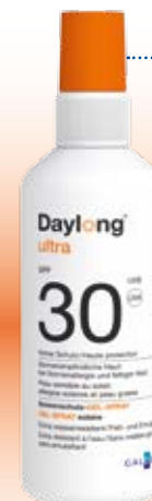
Daylong™ ultra Gel-Spray SPF 30

besonders geeignet für zu Sonnenallergie neigende sowie fettige Haut.