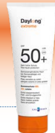
Daylong™ extreme SPF 50+ Lotion

gut geeignet für die Anwendung auf schwierig zu erreichenden oder behaarten Körperstellen.