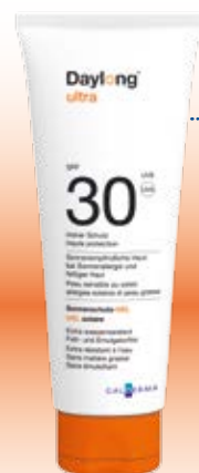
Daylong™ ultra Gel SPF 30

Die neuen Daylong-Sonnengele bieten Sonnenhungrigen dreifachen Schutz: Erstens vor Sonnenbrand, da die UVA- und UVB-Filter schnell und gleichmäßig in die oberste Hautschicht einziehen. Zweitens schützen sie vor Zellschäden, indem sie die DNS vor den schädlichen Einflüssen der UV-Strahlung abschirmen. Und drittens bieten sie auch Schutz vor Hautalterung, da sie die Infrarot-Strahlen der Sonne, die die Haut erschaffen und vorzeitig altern lassen, abwehren. Zudem pflegen sie die Haut mit Vitamin E. Die Wirksamkeit und Hautverträglichkeit wurde bei Anwendern mit Sonnenallergie nachgewiesen.