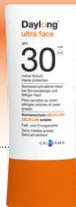
Daylong™ ultra face Gelfluid SPF 30

besonders geeignet für zu Sonnenallergie neigende sowie fettige Haut.