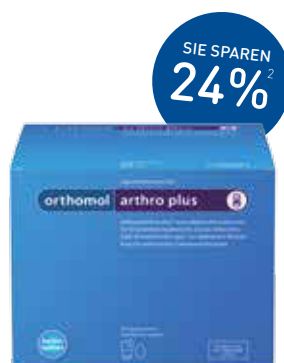
Orthomol Arthroplus Granulat/Kapseln – 30 Stück