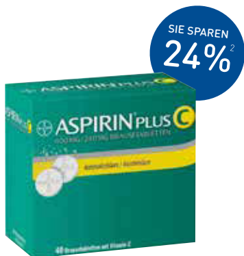
Aspirin plus C Brausetabletten – 40 Stück