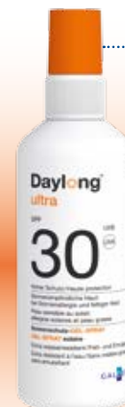
Daylong™ ultra Gel-Spray SPF 30

besonders geeignet für zu Sonnenallergie neigende sowie fettige Haut.