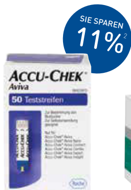
Accu Chek Aviva Plasma Teststreifen – 50 Stück