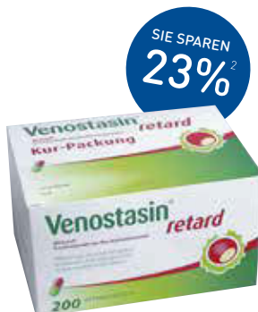
Venostasin retard Kapseln – 200 Stück