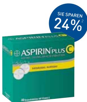
Aspirin plus C Brausetabletten – 40 Stück