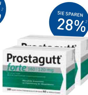
Prostagutt® forte Kapseln – 2x 100 Stück