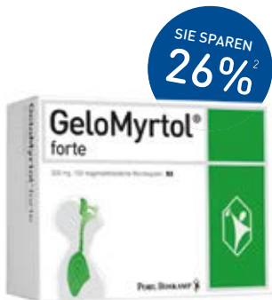
Gelomyrtol forte Kapseln – 100 Stück