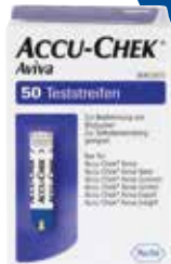
Accu Chek Aviva Plasma Teststreifen – 50 Stück