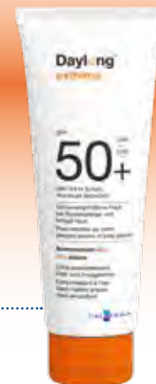
Daylong™ extreme SPF 50+ Lotion

gut geeignet für die Anwendung auf schwierig zu erreichenden oder behaarten Körperstellen.