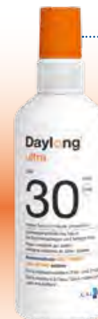
Daylong™ ultra Gel-Spray SPF 30

besonders geeignet für zu Sonnenallergie neigende sowie fettige Haut.