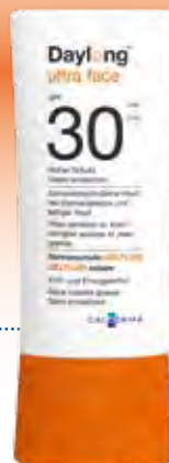
Daylong™ ultra face Gelfluid SPF 30

besonders geeignet für zu Sonnenallergie neigende sowie fettige Haut.