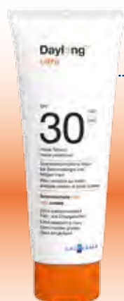
Daylong™ ultra Gel SPF 30

Die neuen Daylong-Sonnengele bieten Sonnenhungrigen dreifachen Schutz: Erstens vor Sonnenbrand, da die UVA- und UVB-Filter schnell und gleichmäßig in die oberste Hautschicht einziehen. Zweitens schützen sie vor Zellschäden, indem sie die DNS vor den schädlichen Einflüssen der UV-Strahlung abschirmen. Und drittens bieten sie auch Schutz vor Hautalterung, da sie die Infrarot-Strahlen der Sonne, die die Haut erschaffen und vorzeitig altern lassen, abwehren. Zudem pflegen sie die Haut mit Vitamin E. Die Wirksamkeit und Hautverträglichkeit wurde bei Anwendern mit Sonnenallergie nachgewiesen.